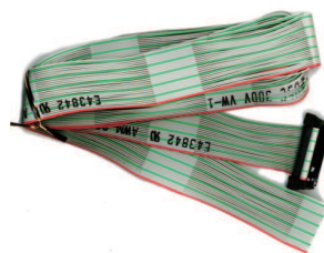
オプションケーブル