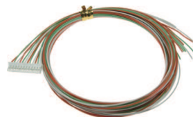
出力用オプションケーブル T-CVPH12010 (8chの場合は2本必要です)